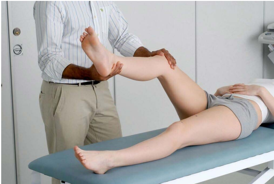
Demostración de la prueba de McMurray