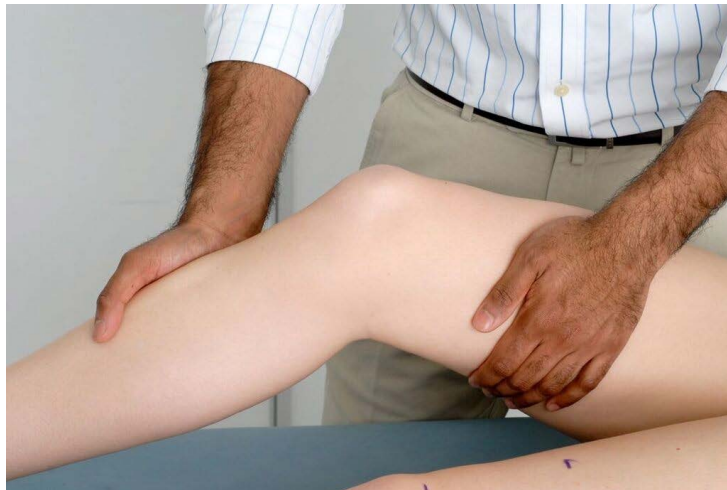
Examinar el ligamento colateral lateral