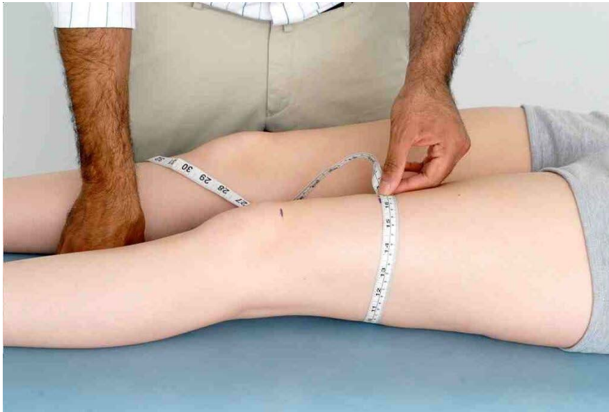
Medir la circunferencia del muslo para desgaste de los cuádriceps

c) Medir la circunferencia del muslo para desgaste de los cuádriceps (en el punto fijo por encima de la tuberosidad tibial, o 10 cm por encima del polo superior de la rótula)