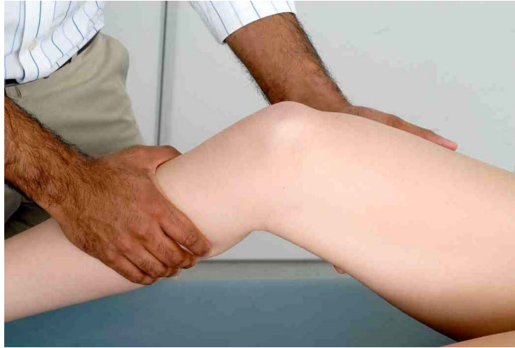
Examinar el ligamento colateral medial