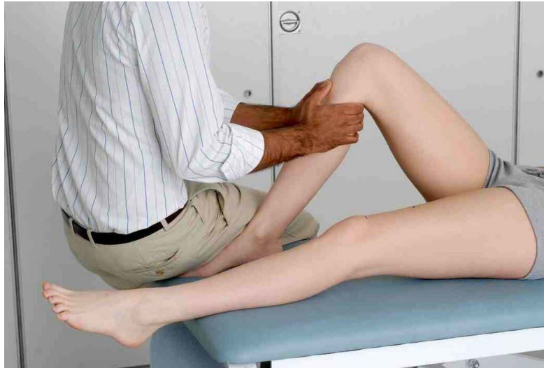
Demostración de la prueba de cajón anterior