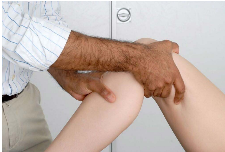
Demostración de la prueba de cajón posterior