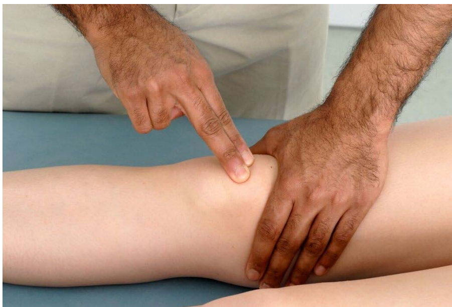
Demostración de prueba de choque rotuliano